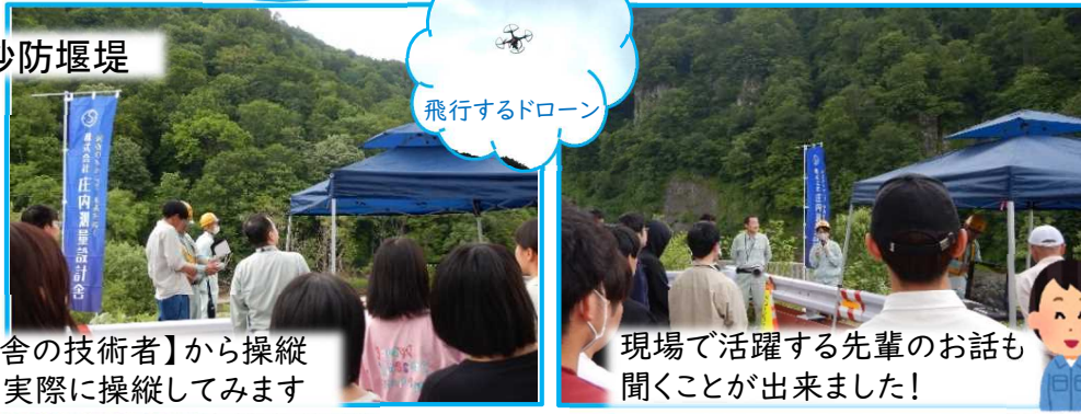
飛行するドローン

【(株)庄内測量設計舎の技術者】から操縦方法を教えてもらい、実際に操縦してみます