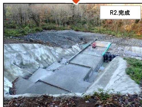
※上の写真の★地点から撮影