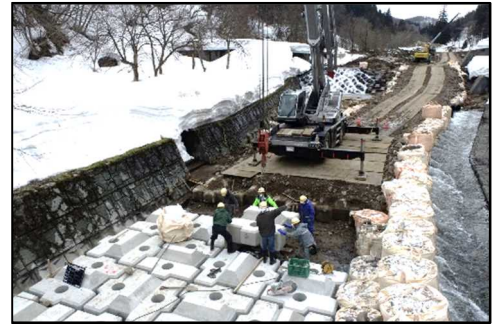
クレーンを使ってブロックを並べる様子

工事車両の通行が増加するなど周辺にお住まいの方にはご迷惑をおかけしますが、引き続きご理解とご協力をよろしくお願いいたします。