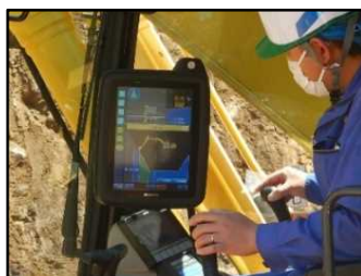
掘削にはICT技術を活用