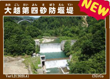
【大越第四砂防堰堤】 （道の駅にしかわ月山銘水館）