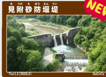
【見附砂防堰堤】 （大井沢温泉湯ったり館）