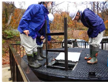
▲集水井の削工の現場を見学しました（集水井工内部）