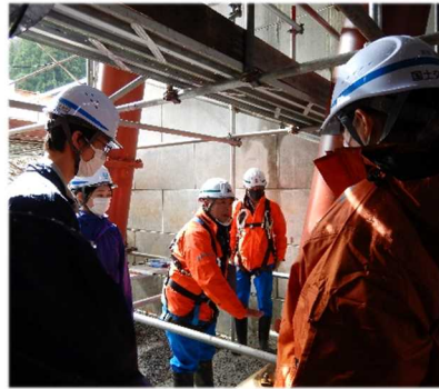
▲鋼製スリット内を見学