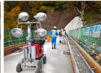
パトロールの様子(横岫沢・志津)