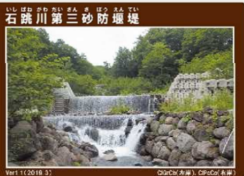
【石跳川第三砂防堰堤】 （月山弓張平公園パークプラザ）

※配付場所が変わりましたのでご注意ください。配付時間は施設の営業時間内に限ります。