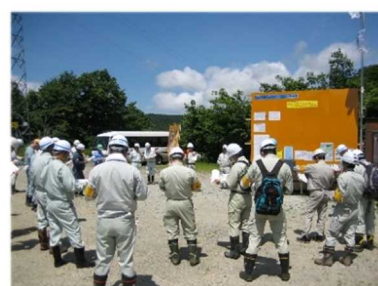
●◎●◎● 点検のようす(西川町志津) ●◎●◎●

本誌をご覧頂いた感想や砂防事業、国土交通省の事業へのご意見、ご質問等をお寄せください。