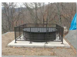
▲集水井のイメージ

《概要》志津地区の地すべり対策として、地すべりの要因である地下水を排除するための集水井と工事用道路をつくる工事です。