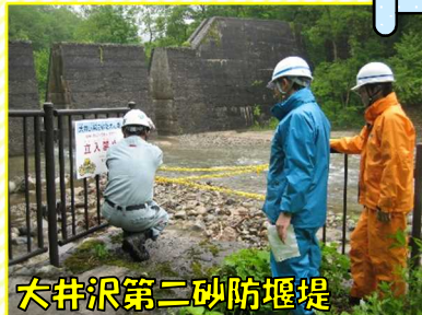
大井沢第二砂防堰堤

日常的に水辺利用が多い西川町内の砂防施設5ヶ所を巡回し、利用に支障となっているところや危険な箇所がないか等を点検しました。特に利用が多くなる夏休み前の7月に、2回目の点検を実施する予定です。