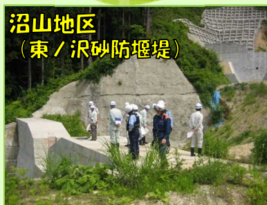
沿山地区 (東/沢砂防堰堤)