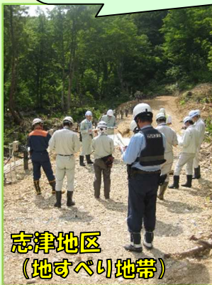
志津地区 (地すべり地帯)