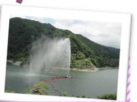
↑迫力満点の、月山湖大噴水 (撮影: 6月26日)