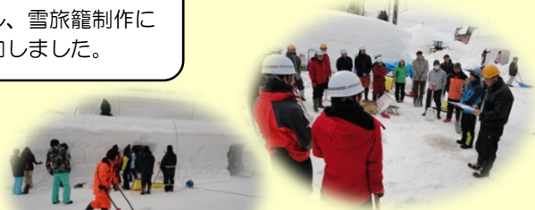
←切り出された雪を ひたすら運びます