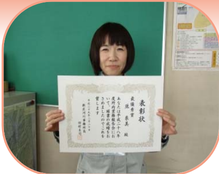
最優秀賞を受賞した 巨事務係長

平成29年度も引き続き安全施工に努めて参りますので、事業に対するご理解・ご協力をお願い申し上げます。