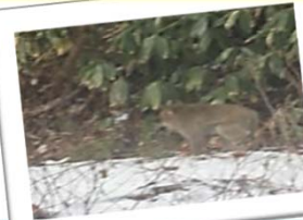
裏山に現れた「猿」 撮影 2016.12.26

本誌をご覧頂いた感想 や砂防事業、国土交通省 の事業へのご意見、ご質 問等をお寄せください。