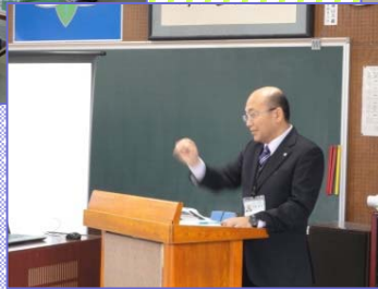
講義を行っている出張所長