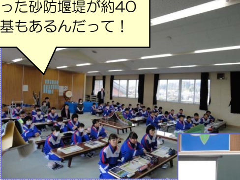
真剣な様子で講義を聞く中学生のみなさん