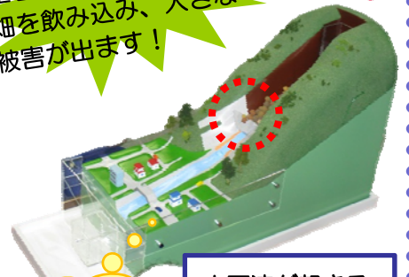
土石流が起きる模型です