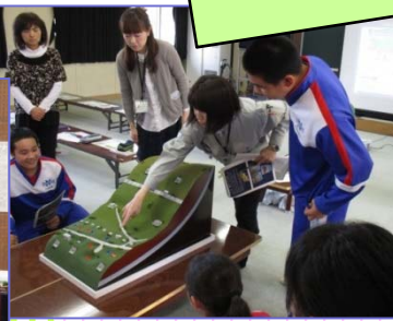
地すべりが起きる模型を使った、実験の様子