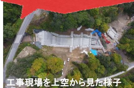
工事現場を上空から見た様子