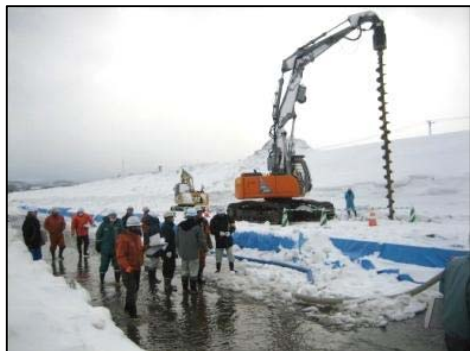
河川の工事現場をパトロール

1月29日(水)、大石田出張所管内において村山地区第2回安全パトロールを実施しました。安全パトロールは、請負工事の安全施工と労働災害の未然防止を目的として、発注者と受注者が合同でパトロールを行っています。今回は、2箇所の工事現場を点検し、作業時の安全対策や危険となりうる箇所の有無などを細かく点検しました。