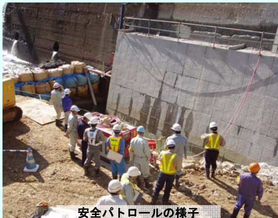
安全パトロールの様子