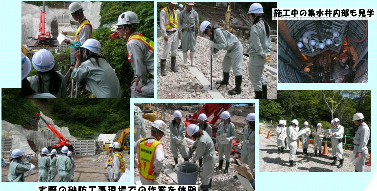
施工中の集水井内部も見学

9月7日（水）、キャンプ砂防in月山に参加された三重大学、筑波大学などの大学生5名が、志津地区の工事現場を見学され、実際の現場での作業を体験しました。現場では測量やコンクリートの施工といった作業体験や集水井内部などの施工中の現場内部の見学を行いました。専門的な知識を学ばれる学生の皆さんにとって今後の学習に活かせるような体験をすることができたことと思います。