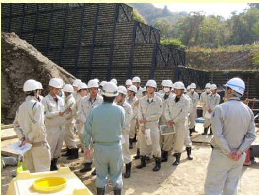
説明を聞く生徒の皆さん (横道沢第5砂防堰堤)

授業で日頃から土木関係の知識を学んでいるということもあり、生徒の皆さんは時折砂防工事に関する質問をしたり、説明者の工事の施工方法についての説明をメモを取りながら真剣に聞き入っていました。