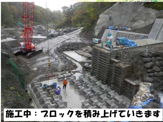
施工中：ブロックを積み上げていきます

石跳川上流からの流出土砂を防ぐための石跳川第四砂防えん堤の築造をおこなっています。工事は順調に進んでおり、今年中に完成の予定です。