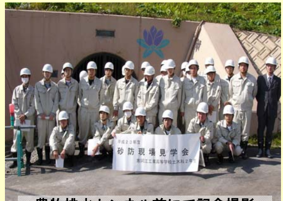
豊牧排水トンネル前にて記念撮影