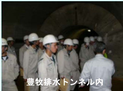
豊牧排水トンネル内