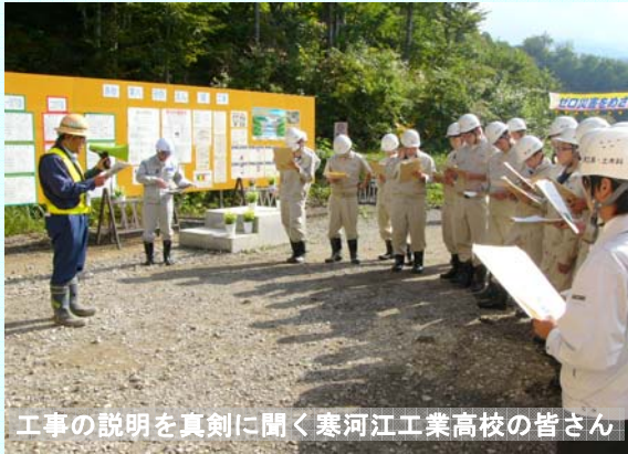
工事の説明を真剣に聞く寒河江工業高校の皆さん

10月8日（金）に寒河江工業高等学校の土木科2年生の皆さんを、大蔵村銅山川流域における砂防・地すべり事業の見学にご案内致しました。