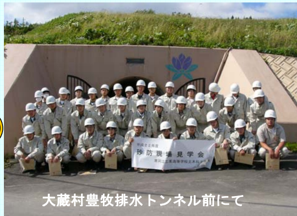
大蔵村豊牧排水トンネル前にて