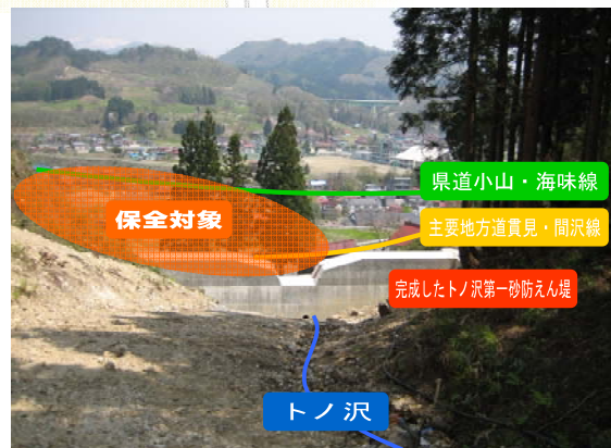
← 山側から保全地区を撮影