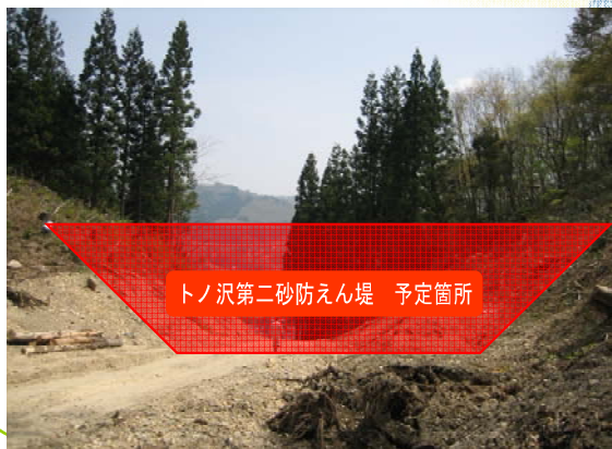
← 第一えん堤のさらに上流側から撮影