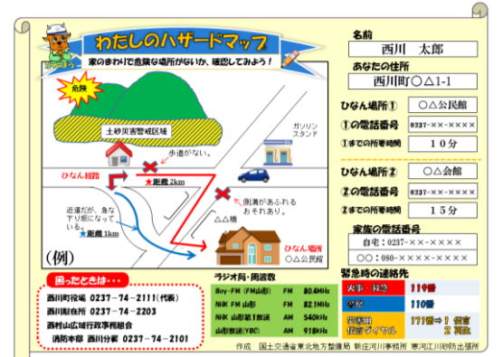
(以前の様式: 広報誌第70号(平成28年12月発行)で紹介)

この様式は、土砂災害から身を守るため、いざという時に備えるために、自分のためのハザードマップを作ることができます。緊急時に必要な連絡先などのほか、自宅の周りの危険な場所や避難場所などを調べて地図を記入します。うら面にも様々な防災情報が書いてあります。緊急時や災害時はあわてやすいものです。いざという時に備えて「わたしのハザードマップ」を作ってみましょう!