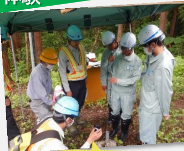
地すべり観測(孔内傾斜計)作業を体験中!