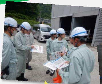
排水トンネルとは何か? 出張所職員が説明中です!