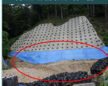
鎌笠沢砂防堰堤 着工前

R2年7月豪雨により被災した鎌笠沢砂防堰堤の法面復旧(昨年度からの継続)や東ノ沢砂防堰堤の法面復旧等を行う工事です