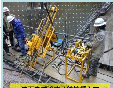
法面を補強する鉄筋挿入工