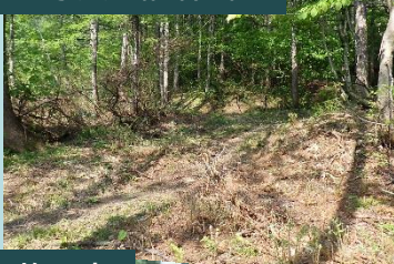
工事用道路 着工前