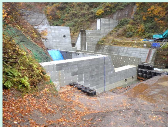
11月現在の鹿の沢第5砂防堰堤