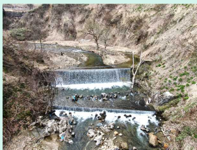
施工前の豊牧砂防堰堤