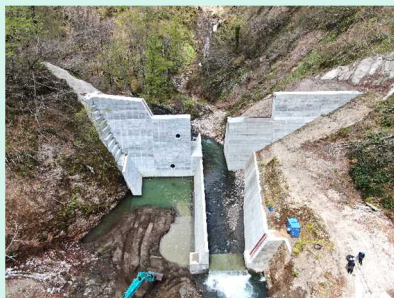
施工前の鹿の沢第5砂防堰堤

今年の7月の豪雨で現場が被災してしまいましたが復旧作業が完了し、現在、副堰堤・側壁のコンクリート打設を行っています。来年度完成に向け、工事を進めてまいります。