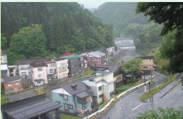
現在の肘折温泉街と肘折砂防堰堤