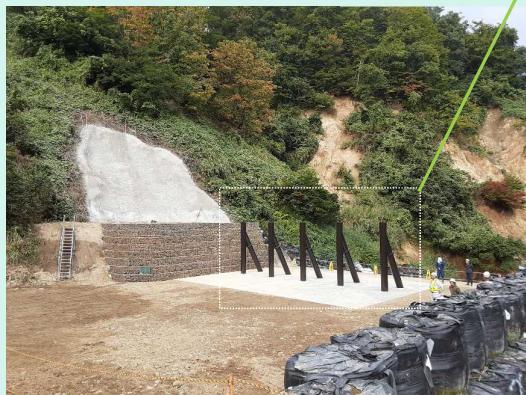
10月現在の豊牧砂防堰堤

↑↑↑↑ 流木止めの高さは約4mもあります！男性の身長と比べるととても大きいです！