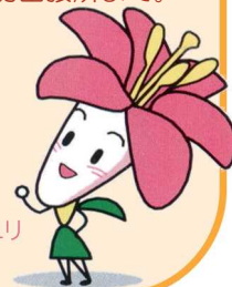
ヒメサクリちゃん

肘折・鹿の沢・舂玉のSABOカードについてのお問い合わせは、下記の銅山川砂防出張所まで。