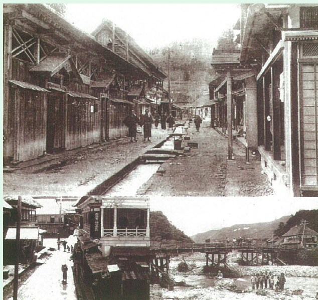
肘折砂防堰堤などができる前の肘折温泉街