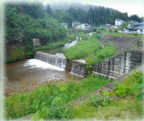
苦水川溪流保全工