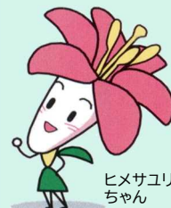
ヒメサクリちゃん