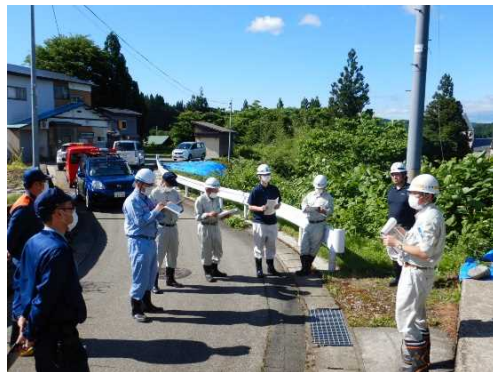
戸沢村での点検の様子

6/17・18に、県・村・警察・消防・防災エキスパート・砂防ボランティアの方々と合同で、危険箇所の点検・パトロールを行いました。急斜面などの崩れやすい危険箇所を確認し、様々な観点から意見をいただいて、今後の対策を検討しました。