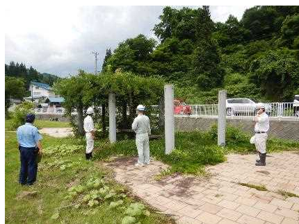
点検の様子 (苦水河川公園)

7/10に大蔵村、警察、消防署の方々と合同で、苦水川河川公園や肘折源泉公園など3箇所の安全点検を行いました。