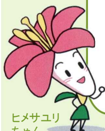
ヒメサユリちゃん

今般の事情により、SABOカードの配付を引き続き一時休止させていただいております。配付の再開については、HPと広報などでお知らせします。