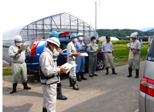
大蔵村での点検の様子