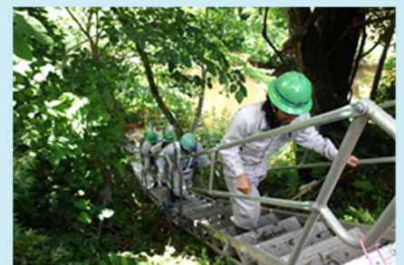
写真4. 安全訓練の様子