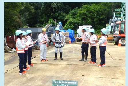
写真2. 女性技術者による安全パトロールの様子