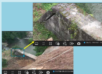
写真3. 至近距離までズームできるカメラの映像