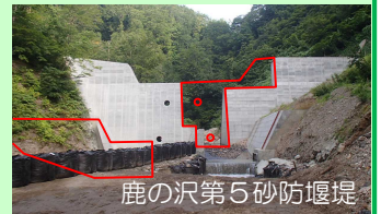
鹿の沢第5砂防堰堤