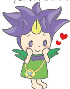
銅山川砂防出張所マスコット リーndon