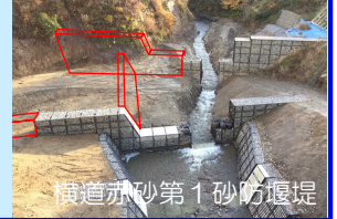
横道赤砂第1砂防堰堤