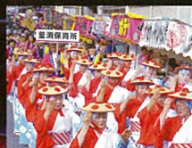
真室川音頭パレード