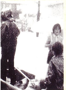
監により大石田町市街地は一 まれました。水防隊員の救助 の綱。