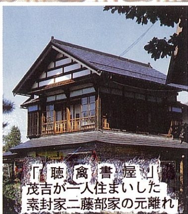
「聴禽書屋」 茂吉が一人住まいした 素封家二藤部家の元離れ