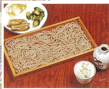
「手打そば」 観光客にも人気、 自慢の手打ちそば