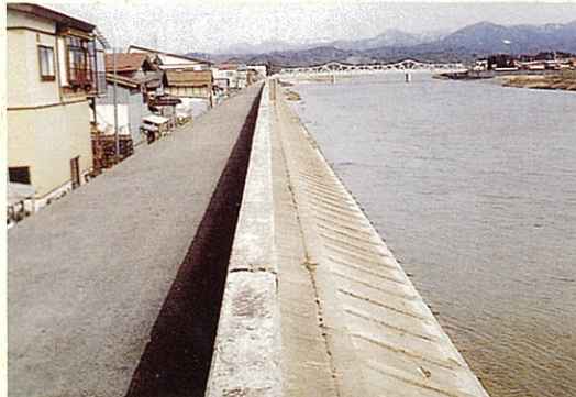
堤防は土堤が原則ですが、土地の状況その他特別の事情により やむを得ないと認められる場合に全部、又は主要な部分をコン クリート構造としたものを特殊堤といいます。

『住みよい文化都市大石田町づくり』の 積極的な推進者の一人。 特殊堤の堀蔵制作に取り組んでおられます。 また、開放講座の講師として 指導いただいています。