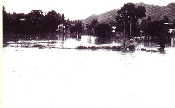
昭和42年8月29日 最上川の水位の急上昇により床上・床下浸水、田畑の冠水続出の大石田町豊田地区。被害者は舟で必死の避難。