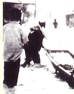
昭和44年8月8日 最上川の面濁流の活動が凍