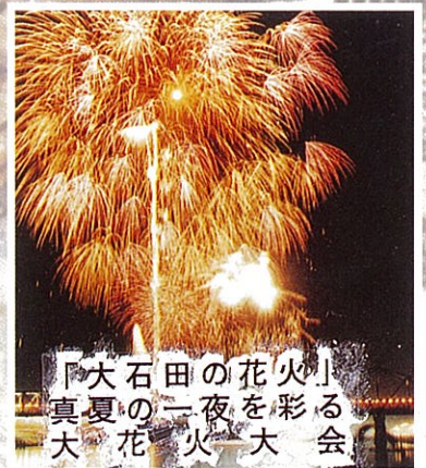
「大石田の花火」 真夏の一夜を彩る会 大花火大会