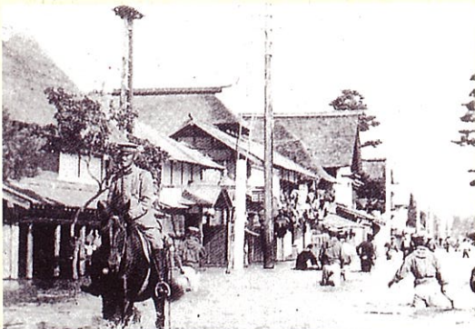
大正2年8月27日 未曾有の洪水に見舞われた大石田の中心地。

自然の怒りが洪水となり、大石田町に多大な被害をもたらし、人と川との戦いも幾たびか繰り返されてきました。