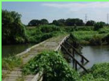
ピオトープの整備