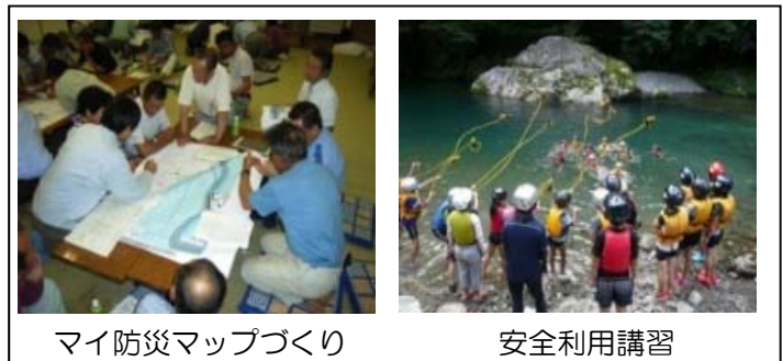
マイ防災マップづくり