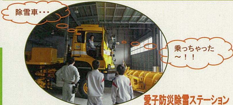
愛子防災除雪ステーション

見学会・職場体験にお越しくくださった皆様、ありがとうございました。機会がありましたらまた遊びに来てください。 施設見学にご興味を持たれた方、ぜひ足を運んでみてください。お待ちしております。