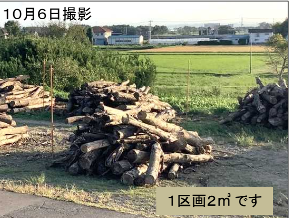
1区画2m 3 です