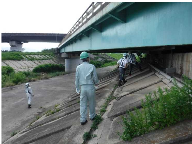
▲許可工作物点検（NEXCO橋梁）