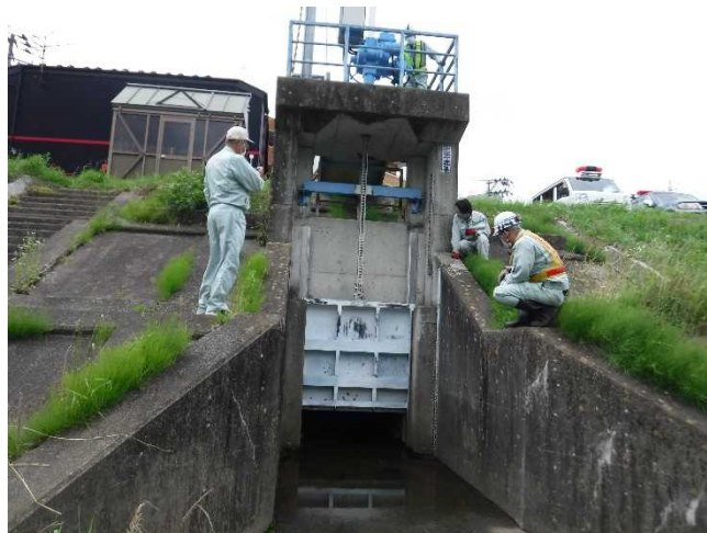
▲許可工作物点検（仙台市樋管）