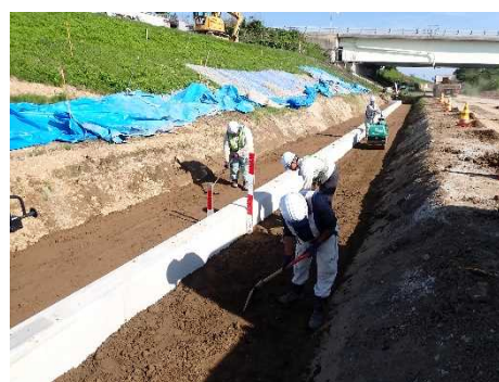
地に打ち込んだ矢板の埋め戻し