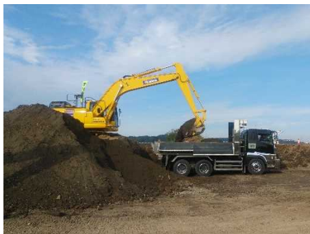
堤防を作るための土砂積込