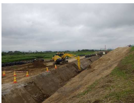
矢板を打ち込むための掘削