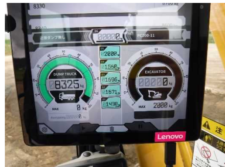
最新技術を使用しての工事管理