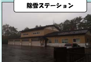
除雪ステーション