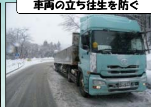
車両の立ち往生を防ぐ