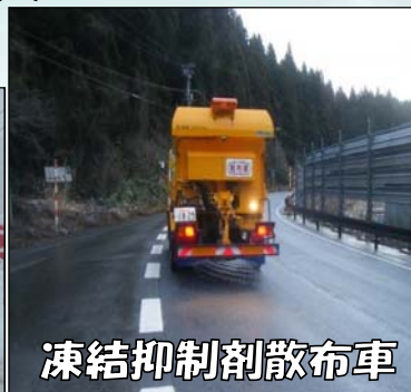
凍結抑制剤散布車