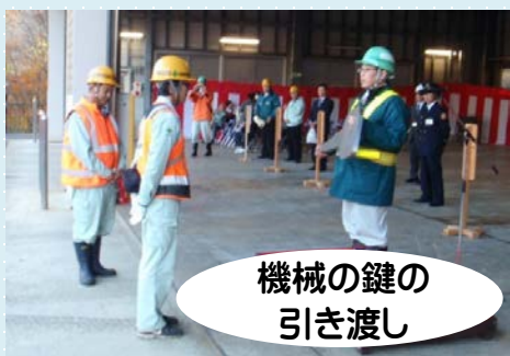
機械の鍵の 引き渡し