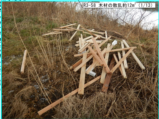
R3-58 木材の散乱約12㎡ (1/13)