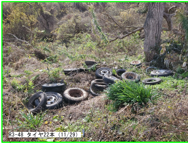
R3-48 タイヤ22本 (11/29)