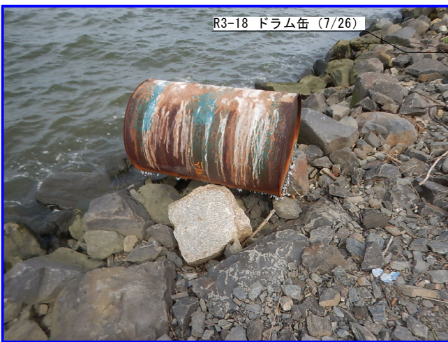
R3-18 ドラム缶 (7/26)