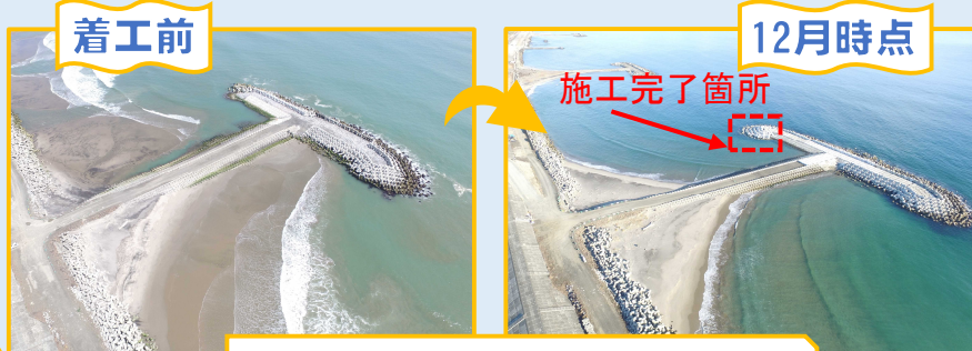
仙台湾南部海岸S1号HL整備工事