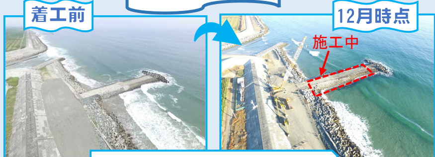
仙台湾南部海岸1号HL整備工事