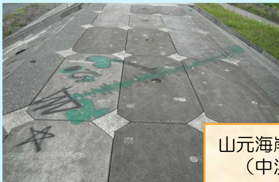
山元海岸山元地区 (中浜工区)

当出張所では毎週、山元海岸（笠野・中浜工区）と岩沼海岸（蒲崎工区）のパトロールを実施して異常がないかの確認や、危険箇所への注意喚起看板の設置などをおこなっています。10月のパトロールで堤防への落書きが見つかりました。