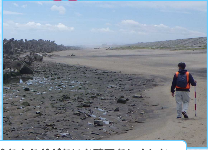
徒歩により広い砂浜を、危険な穴などがいないか確認をしました