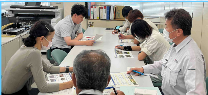
▲緊急巡視における注意点の共有