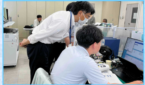
▲スマートフォンの動作確認