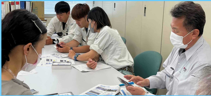
▲スマートフォンの操作説明

災害時や気象・海象の状況により緊急の巡視を行った際、このシステムを使用することで現場から被害状況の報告を受け情報を共有することにより復旧作業を迅速に行います。