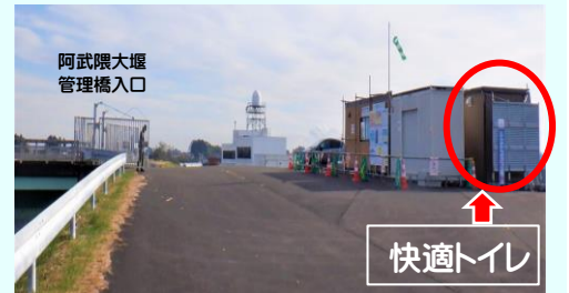
阿武隈大堰管理橋入口

※快適トイレの開放時間：平日9:00～16:00 (3月19日まで土日祝日・休工日を除く)