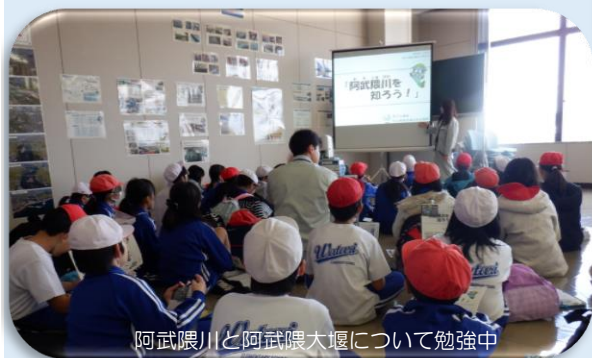
阿武隈川と阿武隈大堰について勉強中

『地図で見たときより、阿武隈川は大きくて、流れが速いと感じた』と感想を話してくれた子がいたっちゃ♪学校の机の上だけではなく、たまには学校を飛び出しての総合学習。素晴らしいっちなね♪