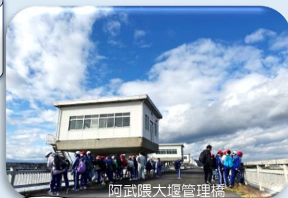
阿武隈大堰管理橋