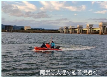
阿武隈大堰の船着場近く

10月28日(月)、船上巡視を行い、陸上からの巡視ではわかりにくい護岸浸食や土砂推積など、42箇所を確認しました。今回の船上巡視で、早急に対応が必要な異常箇所はありませんでした。