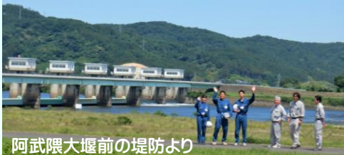
阿武隈大堰前の堤防より

阿武隈川下流の流量観測等でお世話になっている（株）ダイワ技術サービスさん。今回は、インターンシップの学生さんと一緒に阿武隈大堰と流域治水について学ばれました。午後は学生さんが、阿武隈大堰からの流量観測を実際に体験されました。