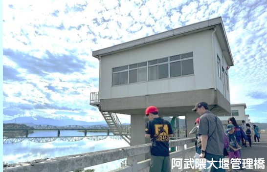
阿武隈大堰管理橋