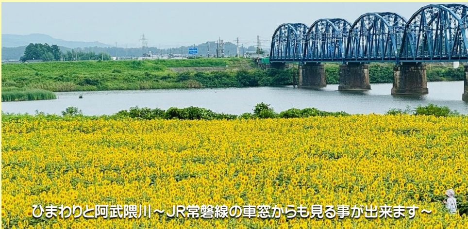
ひまわりと阿武隈川～JR常磐線の車窓からも見る事が出来ます～

8月12日、6月に逢隈小学校の児童と逢隈中学校の生徒たちが種蒔きしたひまわりの花が見頃を迎えていました。この後、約2週間の時間差で種蒔きをしたひまわりも咲き出し、ひまわり畑を長い間楽しむ事が出来ました。