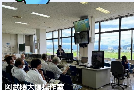
阿武隈大堰操作室