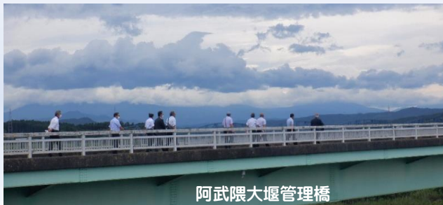
阿武隈大堰管理橋