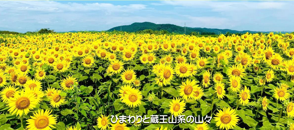
ひまわりと蔵王山系の山々