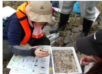
29種類の指標生物をカウント中

水生生物調査とは、川に住む生き物を採集し29種類の指標生物の数を調べることで、水質（よごれの程度）を総合的に評価する調査です。他にもパックテストや水の透明度を目視で確認したりして川の水が綺麗かどうかを調べます。調査の結果、今年も白幡橋近くの川の水は『綺麗な水』となりました。