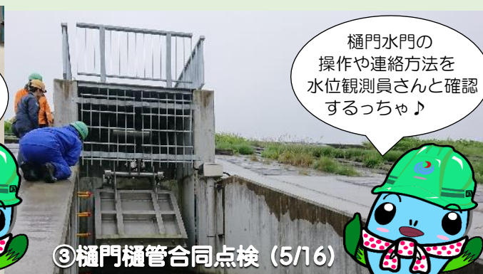
③樋門樋管合同点検 (5/16)