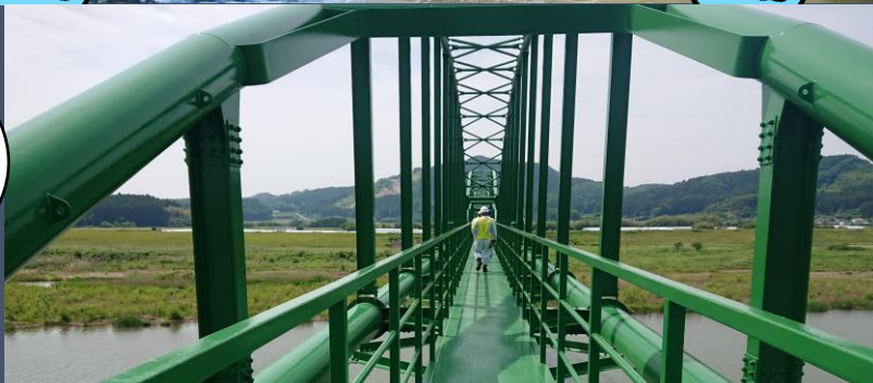
⑥許可工作物点検 (5/23・5/30)

阿武隈川下流に 設置されている許可工作物 (鉄道橋・道路橋・工業用水や 水道用水の取水口)など17箇所 を各施設の管理者と一緒に点検 して、連絡体制等も再確認 するっちゃ♪