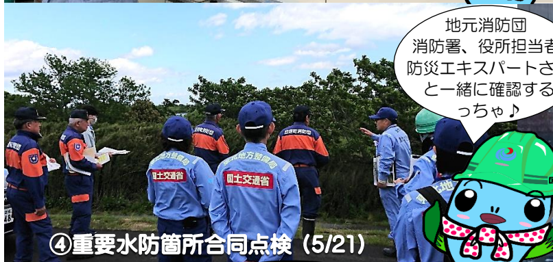
④重要水防箇所合同点検 (5/21)

地元消防団 消防署、役所担当者 防災エキスパートさん と一緒に確認する っちゃ♪