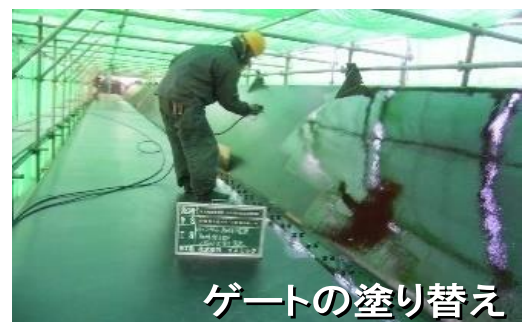
ゲートの塗り替え