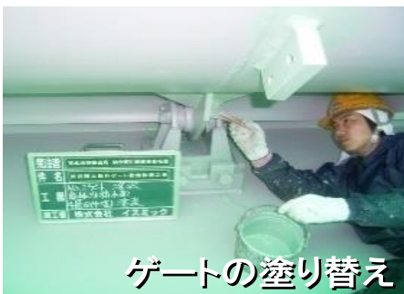
ゲートの塗り替え