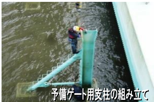
予備ゲート用支柱の組み立て

昭和57年（1982年）4月の完成以来、阿武隈川の安定した水の流れの確保と、かんがい用水、工業用水等の安定供給の役割を担っている阿武隈大堰。完成から今年で42年。これからもずっと阿武隈大堰が地域の安全安心を守り続けるために、毎年、雨の少ない冬の時期（11月～3月）にメンテナンス工事を行っています。水を堰き止める為の巨大な10個のゲートを毎年1ゲートずつ、今年度は、第5ゲートを工事中です。極寒の中で工事を行ってくださっている皆さま、いつも本当にありがとうございます。この巨大な阿武隈大堰をスムーズにそして安全に動かすために、毎月の点検やメンテナンスなど、たくさんの人の知恵や力が結集されています。