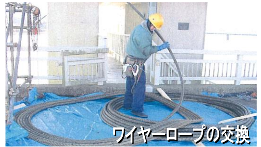
ワイヤーロープの交換