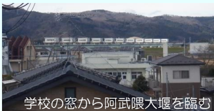
学校の窓から阿武隈大堰を臨む

児童たちは1年を通し防災教育の中で「 命を守る行動をとるために 」どうすべきかを学んでいます。きっかけは、 東日本大震災の記憶の風化 。3年前から逢隈小学校では、自分のそして家族の命を守る防災の話しを、いろいろな方面の先生から学んでいるそうです。