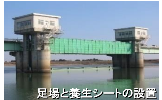
足場と養生シートの設置