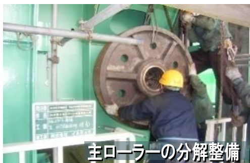
主ローラーの分解整備