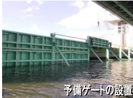
予備ゲートの設置