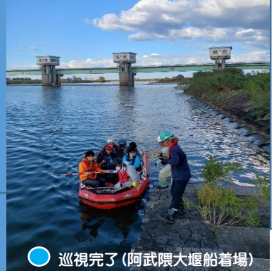
● 巡視完了 (阿武隈大堰船着場)