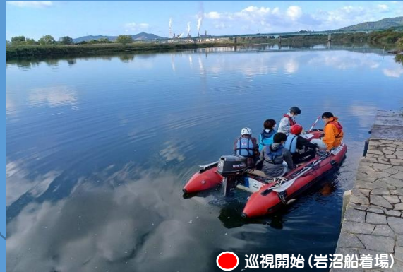
● 巡視開始 (岩沼船着場)