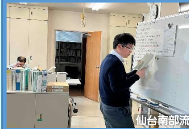
仙台南部流域治水出張所