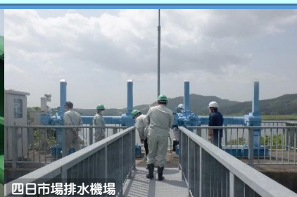
四日市場排水機場