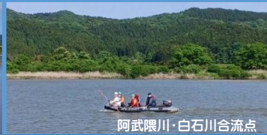
阿武隈川・白石川合流点