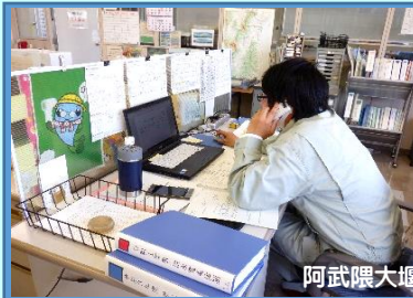
阿武隈大堰管理分室

『いざという時に、どんな行動を取る？連絡はどうする？』一般のご家庭でも、家族で話し合っ て事前に決めておくことをお勧めします。