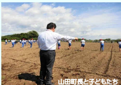
山田町長と子どもたち