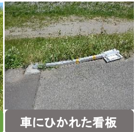
車にひかれた看板