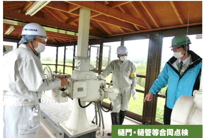
樋門・樋管等合同点検

しかし、想定外！なんてことも起こります。そんな時その瞬間！命を守ることが出来るのは、流域に暮らす皆さまそれぞれが持つ防災力です！何かあっても慌てないで命を守れる力をつけておきましょう。