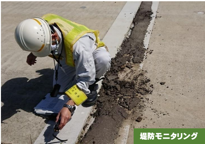
堤防モニタリング

阿武隈川の出水期は6月1日～10月31日。そういえば、昨年の台風19号が日本に上陸したのは10月12日でしたね。岩沼出張所は、毎年この出水期に向けて大雨や台風が来ても堤防が安全に機能するように、モニタリングや設備点検・訓練などを行い万全を期して河川の安全を守っています。6月24日までの阿武隈川下流のモニタリングや安全点検で大きな異常はありませんでした。