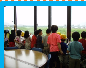
窓から阿武隈大堰を観察