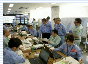
仙台河川国道事務所