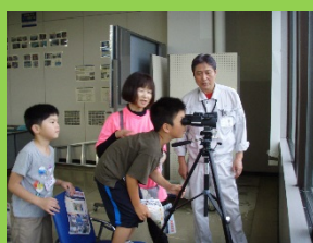
望遠鏡を覗いて観察