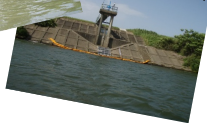
岩沼市上水道取水口