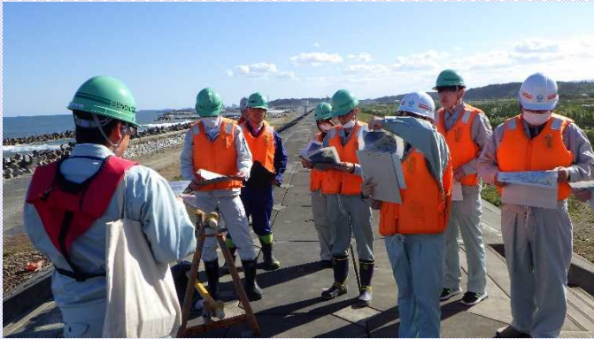
▲施工の説明を受ける様子