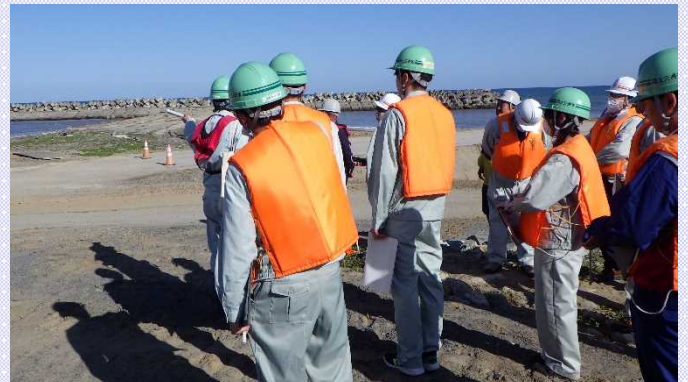
▲ヘッドランド整備工事の見学の様子

S4号ヘッドランドの現場では、侵食された海岸に人工的に砂を供給し侵食防止対策を行っている養浜工の状況を見学し、S1号ヘッドランドの現場ではクローラークレーンを使用した、消波ブロック据付の施工を見学しました。