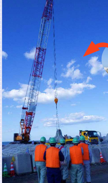
▲消波ブロック据付見学の様子