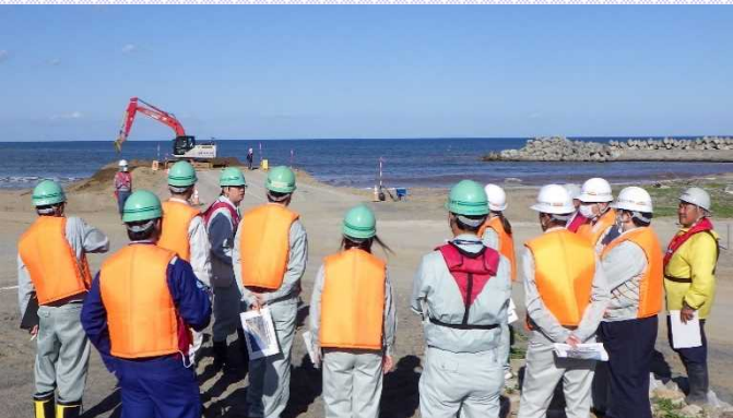
▲養浜工の見学の様子