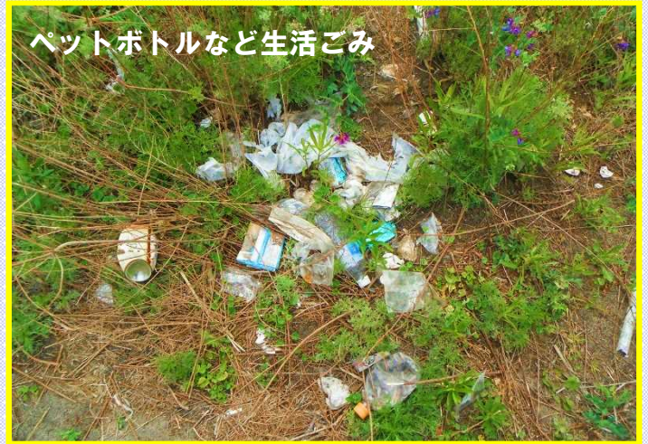
ペットボトルなど生活ごみ