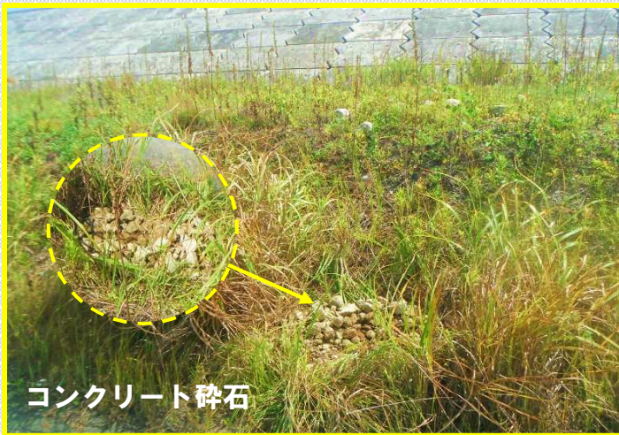
コンクリート碎石