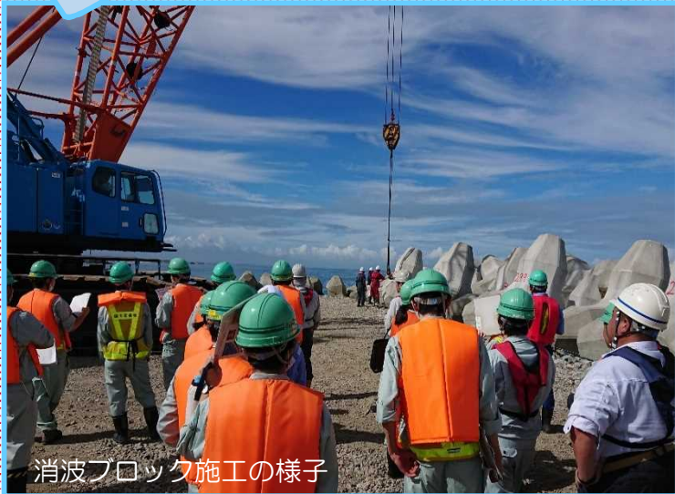
消波ブロック施工の様子