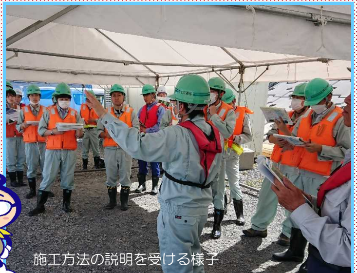
施工方法の説明を受ける様子