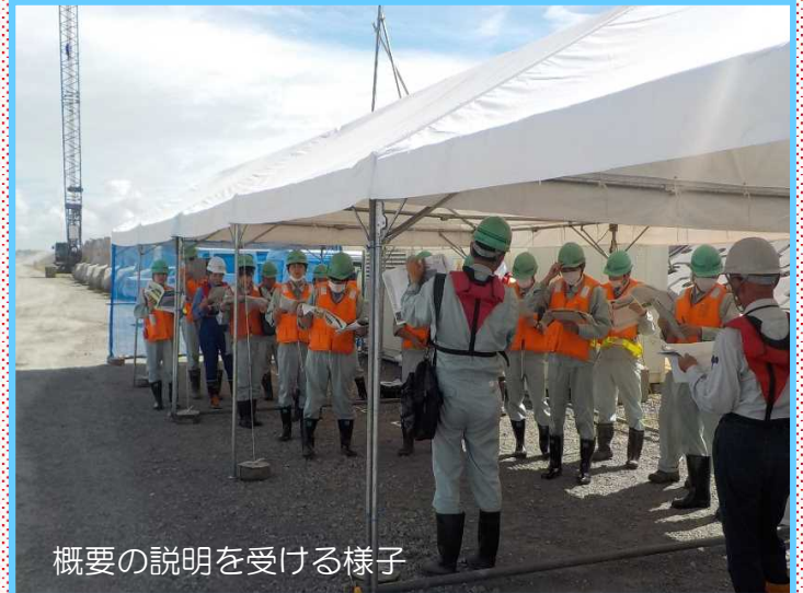
概要の説明を受ける様子