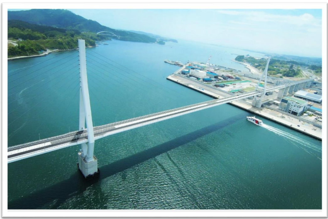
▲ 東北地方最大の斜張橋 愛称は「かなえおおはし」