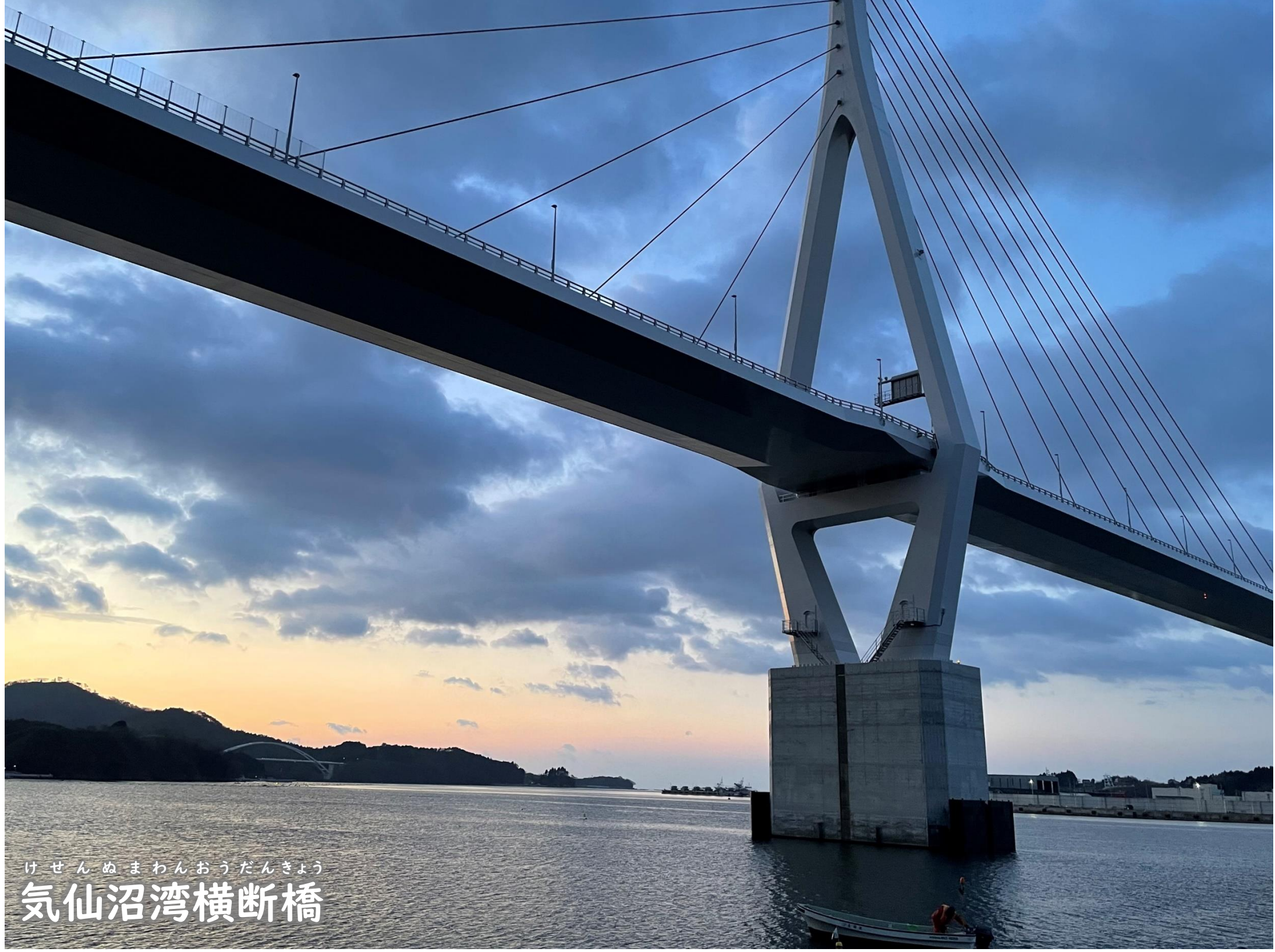
けせんぬまわんおうだんきょう 気仙沼湾横断橋