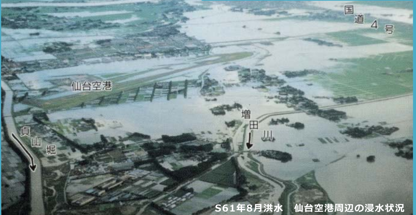
S61年8月洪水 仙台空港周辺の浸水状況