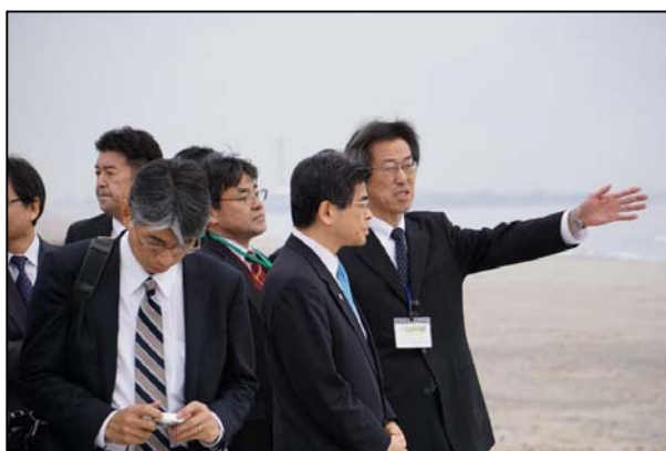
宮田事務所長より説明