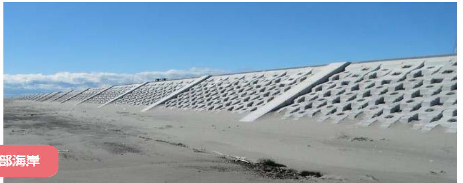
▲ 復旧が完了した海岸堤防（仙台湾海岸／深沼地区） ▲