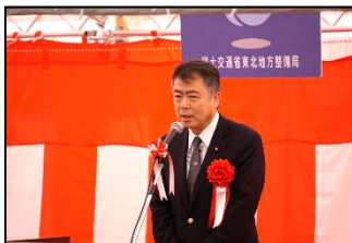
櫻井 充 参議院議員