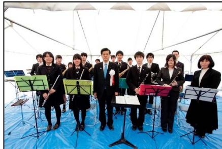
宮城県農業高等学校吹奏楽部の皆さん