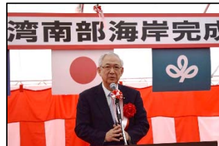
井上 義久 衆議院議員