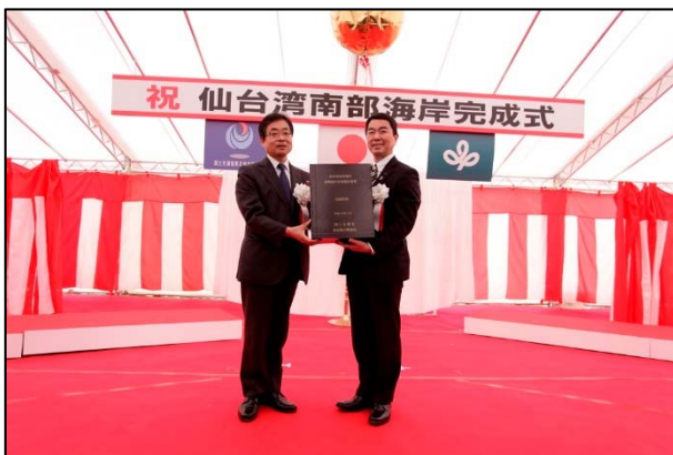
▲東北地方整備局から宮城県知事への代行区間の引き渡し

仙台湾南部海岸堤防復旧の完成を記念し『記念銘板』のお披露目や、『代行区間の引き渡し』を行ったあと、出席者による『くす玉開披』が行われ盛大な拍手に包まれました。