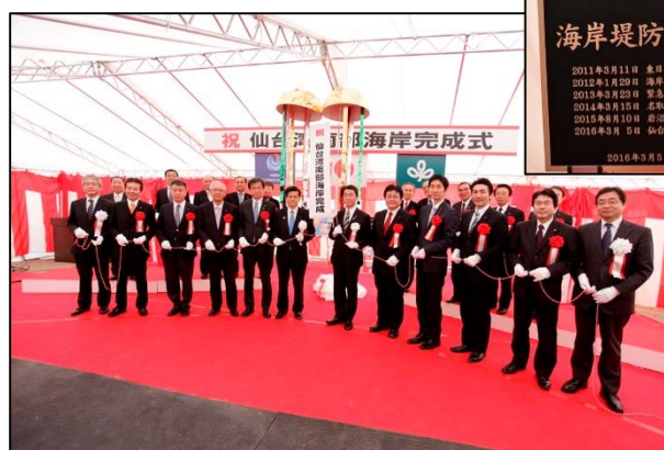
▲関係者によるくす玉開披と地元首長らによる記念銘板の除幕