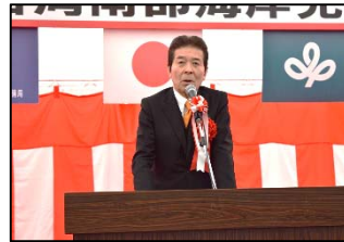
中野 正志 参議院議員