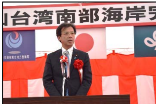
秋葉 賢也 衆議院議員