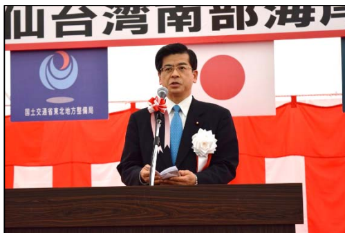
石井 啓一 国土交通大臣