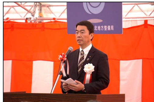
村井 嘉浩 宮城県知事