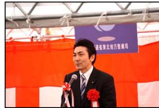
熊谷 大 参議院議員