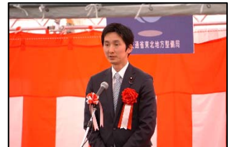
真山 祐一 衆議院議員