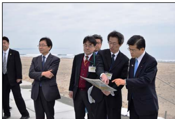
宮田事務所長より説明