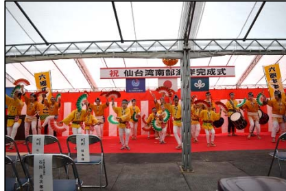
▲すずめ踊りの披露