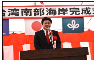
西村 明宏 衆議院議員