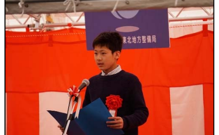
▲地元小学生による作文朗読

仙台湾南部海岸堤防復旧の完成を記念し『記念銘板』のお披露目や、『代行区間の引き渡し』を行ったあと、出席者による『くす玉開披』が行われ盛大な拍手に包まれました。