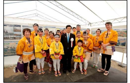
六郷すずめっこの皆さん