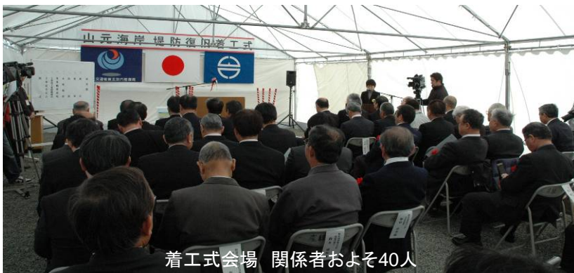
着工式会場 関係者およそ40人