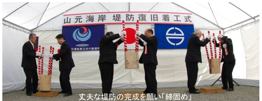
丈夫な堤防の完成を願い「締りめ」