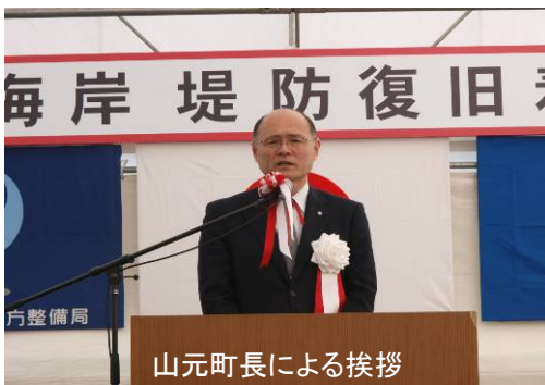
山元町長による挨拶