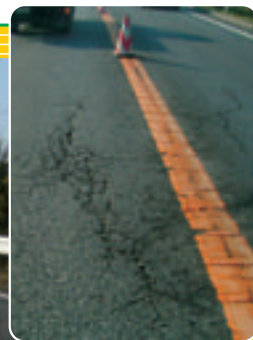
↑ 補修前 ← 補修中